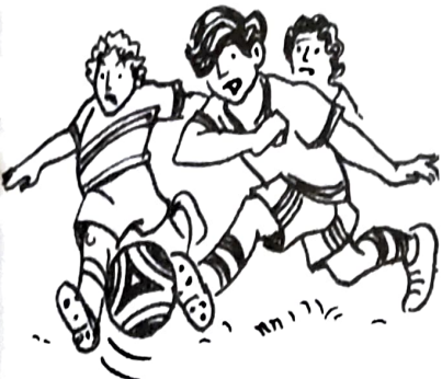
ছেলেরা বল খেলছে